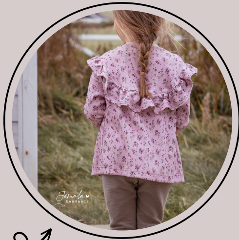
normale (Unisex) länge mit geradem Saum hinten

Alle Varianten ohne Volant werden genau gleich genäht