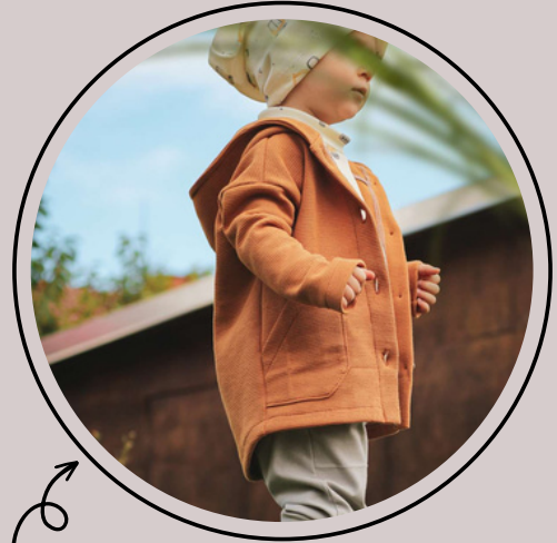
normale (Unisex) länge mit rundem Saum hinten