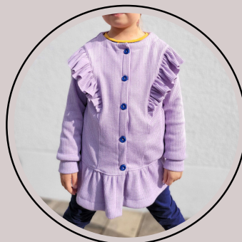
Cardigan mit Saumrüsche