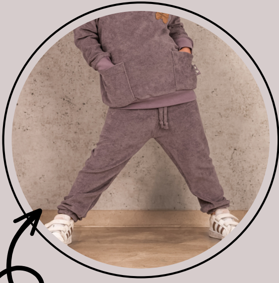
weites Bein mit Bündchen