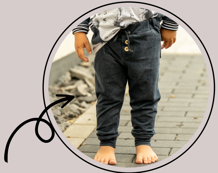
schmales Bein mit Knopfleiste und Gummiband eingezogen mit Jersey Bündchen.