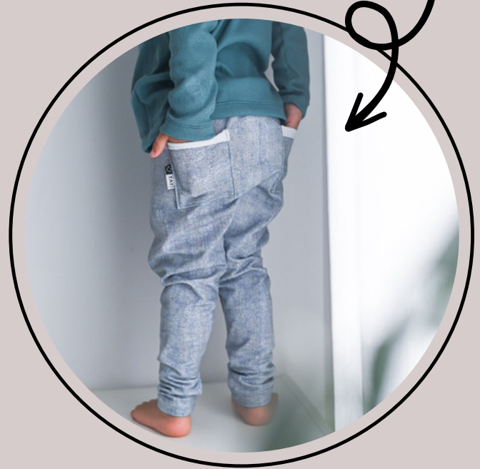
schmales Bein mit eckigen Po-Taschen. Normal gesäumt.