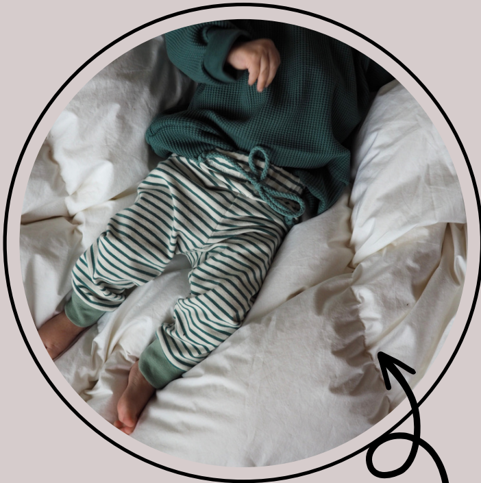
direkt eingenähter Gummi mit Beinbündchen